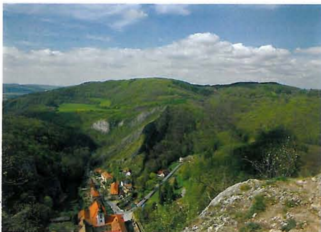
Svatý Jan pod Skalou

Turistika. Nejcennější části území jsou zpřístupněny sítí značených turistických a naučných stezek. V maloplošných chráněných územích buďte, prosíme, ohleduplní k přírodnímu prostředí a pohybujte se jen po cestách. Naučná stezka národní přírodní rezervaci Karlštejn vede z obce Karlštejn přes Svatý Jan pod Skalou do Srbska. Přimyká se k ní kratší okruh okolo Svatého Jana pod Skalou. Naučná stezka na Zlatém koni je zaměřena hlavně na geologické jevy a navazuje na veřejnosti přístupné Koněpruské jeskyně. V Srbsku a v Karlštejně jsou zřízena turistická tábořiště. V Karlštejně je i turistické informační centrum.