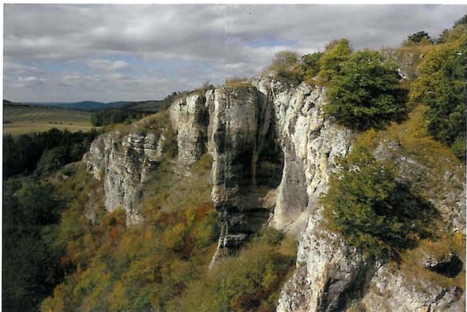
Národní přírodní památka Kotýz

Horninovým podkladem tohoto území jsou převážně prvohorní vápence, celosvětově významné z paleontologického a stratigrafického hlediska, ve kterých se během miliónů let vytvořily četné krasové jevy.